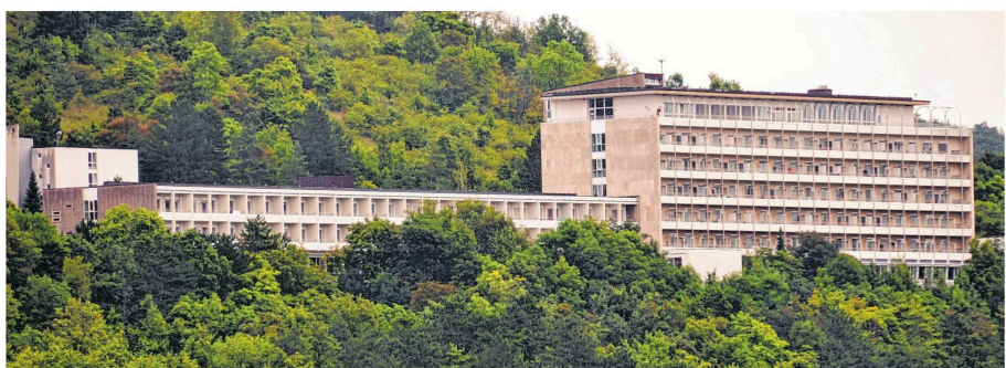
Die Rehaklinik Ob der Tauber hoch über dem Taubertal öffnet am Samstag, 6. Mai, ihre Pforten, um die neuen Räume einer breiten Bevölkerung vorzustellen.