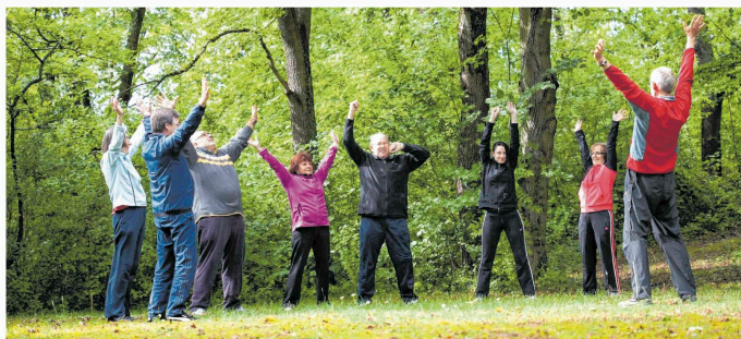
In der Klinik wird ein umfassendes Sport- und Bewegungsprogramm zur Gewichtsreduktion angeboten.