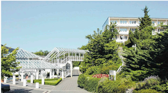
Die Rehaklinik Ob der Tauber ist eine Fachklinik für Verdauungs- und Stoffwechselerkrankungen und Onkologie.

■ UNSERE LEISTUNGEN BEI DER MODERNISIERUNG + SANIERUNG DER REHAKLINIK OB DER TAUBER IN BAD MERGENTHEIM • WERKPLANUNG • AUSSCHREIBUNG • VERGABE • OBJEKTÜBERWACHUNG