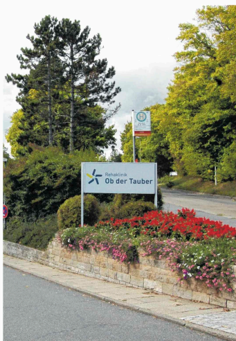
Die Klinik Ob der Tauber wurde 1962 gegründet.